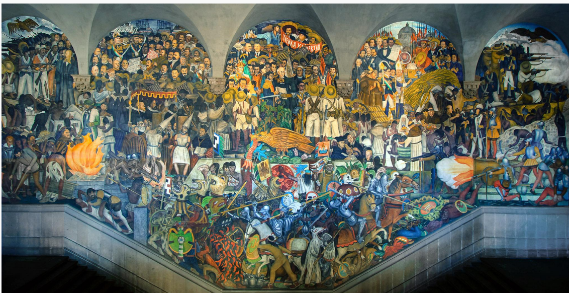
Historia de México a través de los siglos (Diego Rivera, 1935)