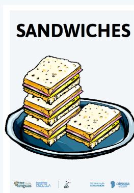
E. FLASHCARDS COMIDAS (tamaño A5) 1grado_eje3_ws2_flashcards_comidas