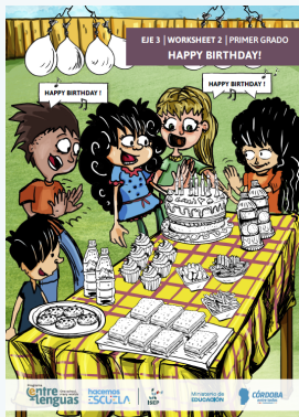
A. IMAGEN DE PORTADA (tamaño A3) 1grado_eje3_ws2_portada

PARA DESCARGAR LOS IMPRIMIBLES A, B, C, D y F, HACER CLIC AQUÍ .