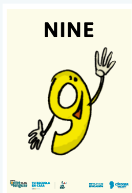
C. FLASHCARDS NÚMEROS (tamaño A5) 1grado_eje1_ws2_flashcards_numeros