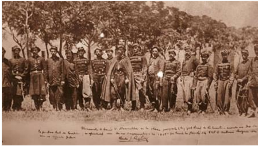
Lucio V. Mansilla junto a sus oficiales, el quinto de derecha hacia la izquierda con capa y espada

¿Recuerdan a Lucio Mansilla, el hermano de Eduarda y subcomandante de la frontera sur? En 1870 partió "tierra adentro" desde el Fuerte Sarmiento, al sur del Río Cuarto, con el objetivo de firmar la paz con los ranqueles. Junto con 18 hombres casi desarmados, recorrió 400 km a caballo desde Río Cuarto, Córdoba, hasta La Pampa, a orillas de la laguna Leubucó.