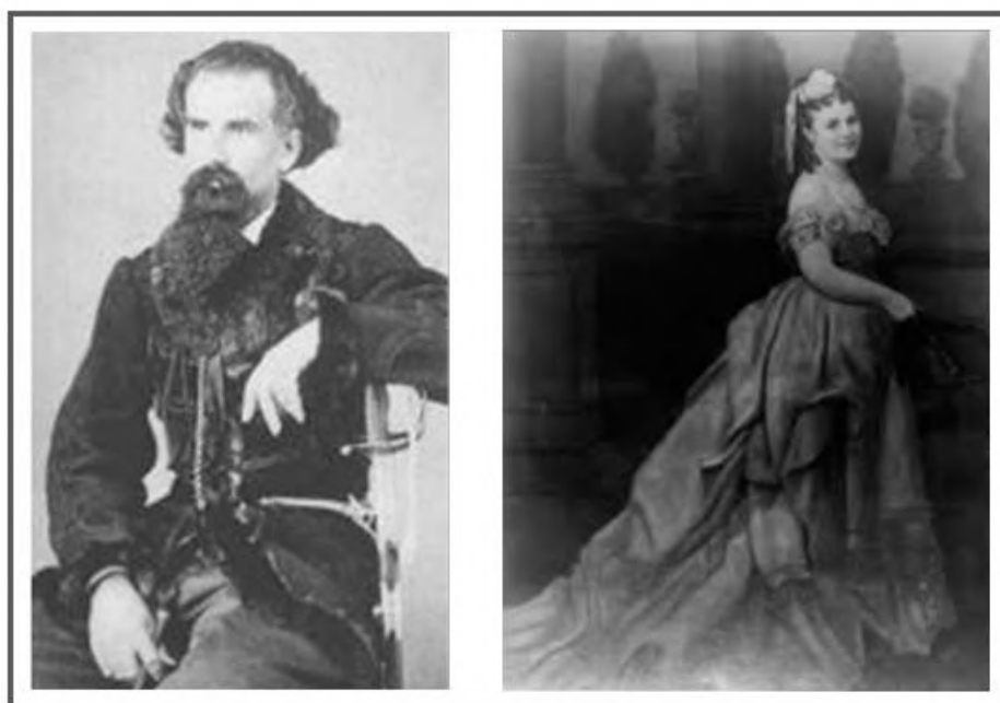
Lucio V. y Eduarda Mansilla Fuentes: Actaliteraria y Eduarda Mansilla

Los hermanos Lucio Victorio y Eduarda formaban parte de los sectores acomodados de Buenos Aires. Cultos y cosmopolitas, ambos con una cuidada educación, fueron destacados personajes de su época que sedujeron con su belleza física y su brillo intelectual.