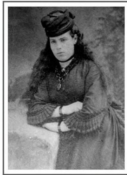
Eduarda Mansilla (1875)

HACER CLIC SOBRE EL ÍCONO PARA ESCUCHAR LAS PISTAS DE IMAGEN 1