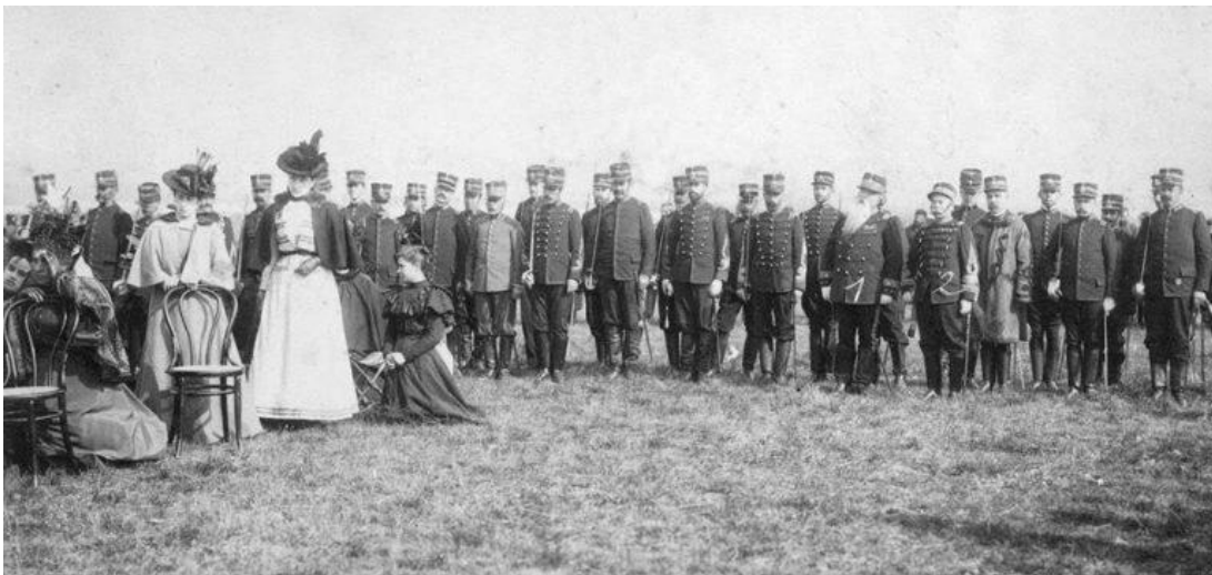
1894. Campamento militar de Tandil, misa de campaña con Nicolás Levalle y el Ministro de Guerra Luis María Campos.

Si miran con atención las dos fotografías que siguen, tomadas por aquellos años, podrán descubrir elementos que distinguen a estos grupos: desde sus vestimentas y sus gestos, (es decir, la mirada, el porte del cuerpo) hasta las distancias “permitidas” entre los cuerpos.