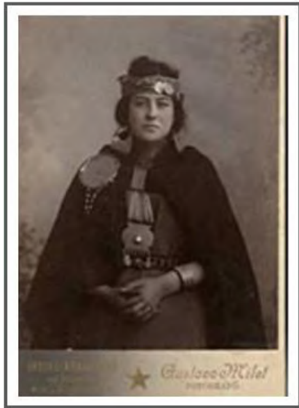
Mujer blanca con accesorios mapuches (1826 - 1899)