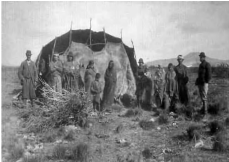
Mapuches en una fotografía de Hans Steffen, 1897

Con cada avance, grupos completos de indígenas quedaban incorporados a los nuevos asentamientos, lo que desmiente la visión simplificada de una población aborigen desalojada en masa hacia el sur por la sociedad criolla. Por otra parte, había indígenas que abandonaban el tradicional toldo construido con pieles de vacuno y estacas, por el rancho de adobe típico de los gauchos, e incluso algunos caciques mantenían una casa dentro de los poblados fronterizos.