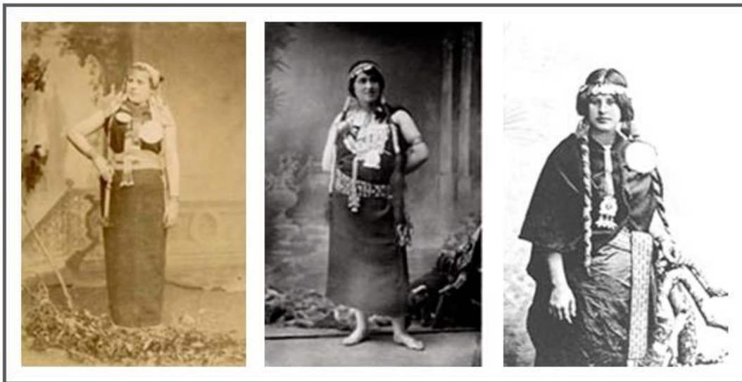
Modelos blancas posando con accesorios mapuches (1860 - 1917)