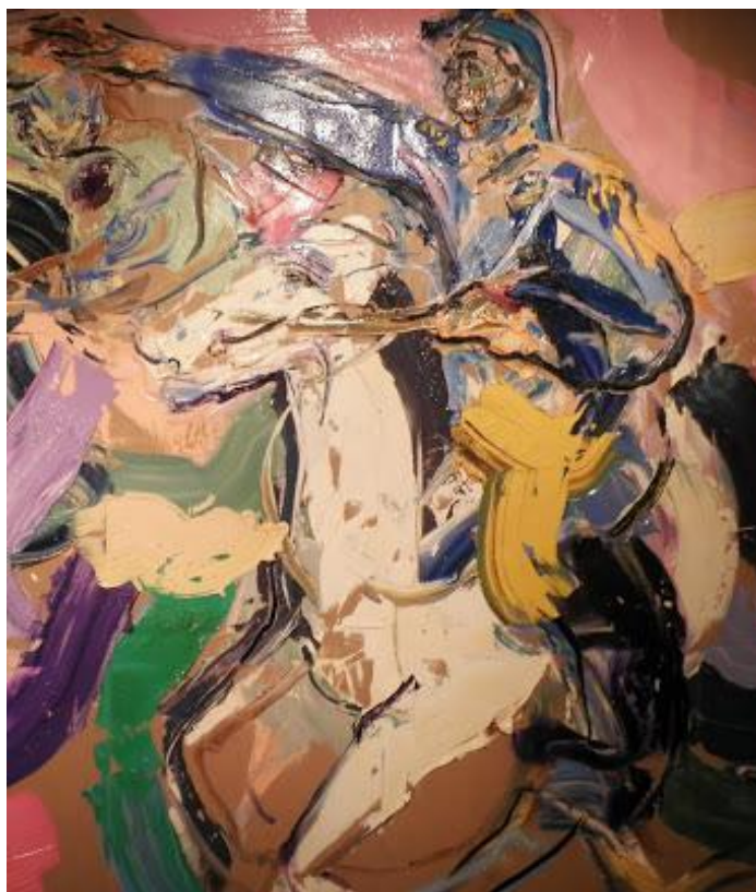
José de San Martín , de Ariel Mlynarzewicz (2010) - Recorte Técnica: óleo sobre tela / Medidas: 180 x 290 cm.

Lo haremos inspiradas e inspirados por la serie de pinturas “Revolucionarios”, de Ariel Mlynarzewicz , en la que se propuso desafiar las imágenes congeladas de los próceres para recrearlas con sus espátulas y sus pinceles. Ariel contó con el apoyo de reconocidos historiadores e historiadoras que lo inspiraron en sus creaciones. La imagen que sigue es un retrato del general San Martín.