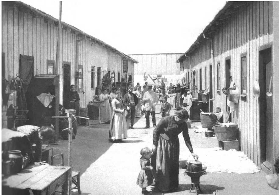
Buenos Aires, conventillo, c.1890.