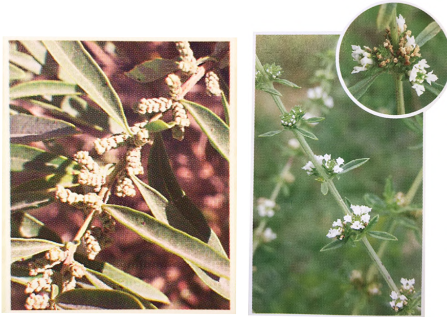
Hierbas de las sierras de Córdoba. Fuente: Martínez, 2015, p. 179