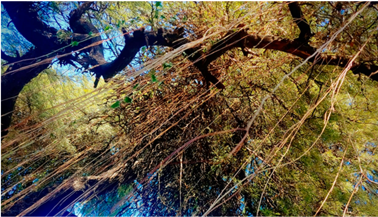
Tacu, La Casona del Pueblo de La Toma.

Después de las guerras de independencia y con los procesos de disolución del orden colonial, en el continente americano surgieron diversos estados que se constituyeron como estados nación negando la preexistencia de todos los pueblos que ya vivían en el continente antes de la época colonial. Continente que, tras la invasión llevada a cabo por europeos, pasó a llamarse América y sus pobladores, a quienes se les negó su diversidad y sus identidades culturales, fueron invisibilizados bajo el nombre genérico (y por cierto erróneo) de “indios”.