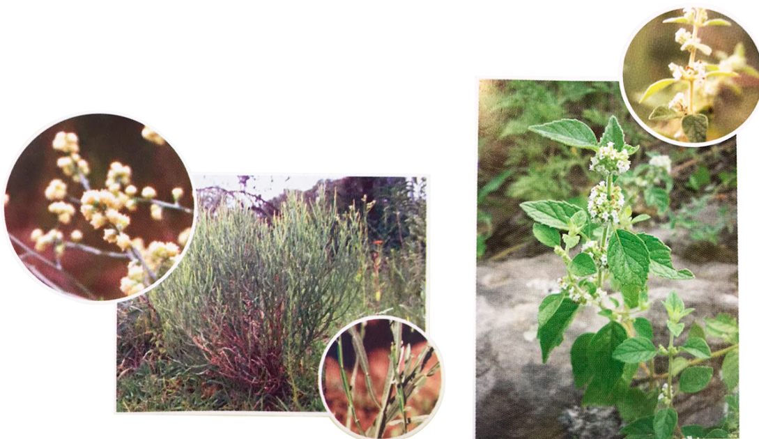
Hierbas de las sierras de Córdoba.