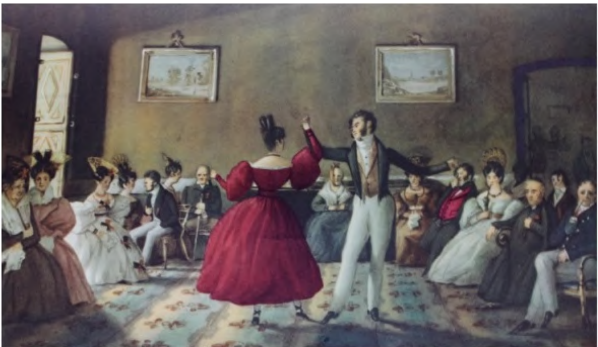
Minuet , por Carlos Enrique Pellegrini.

Observen las pinturas que representan aquellos festejos: