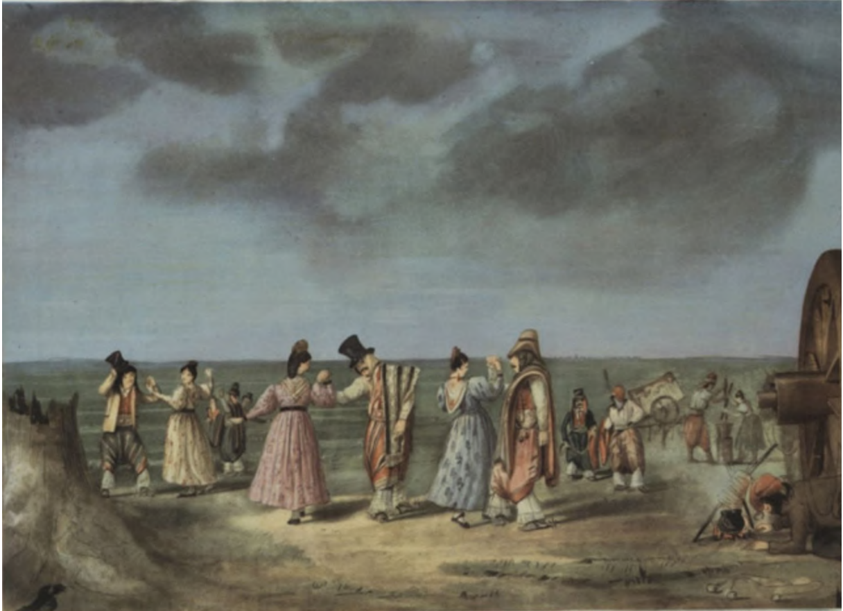
Mediacaña , por Carlos Enrique Pellegrini. Fuente: Biblioteca Nacional de Maestras y Maestros