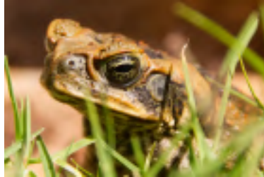
KURURÚ, ROCOCO O SAPO BUEY