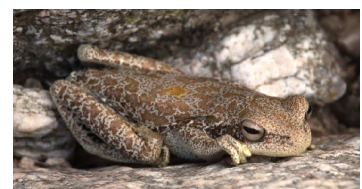
RANA TREPADORA CORDOBESA