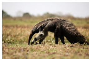
OSO HORMIGUERO O ÑURUMÍ