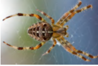
ARAÑA ARGIOPE O ARAÑA TIGRE