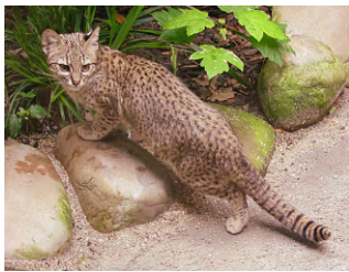
GATO MONTÉS O GATO DE GEOFFROY